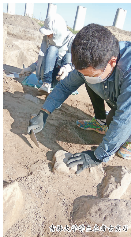
吉林大学学生在考古实习