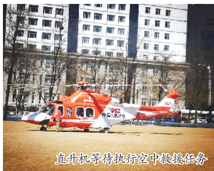
直升机等待执行空中救援任务

患者是一名30岁的男性,在高空作业时不慎坠落,导致上肢、腰椎、骨盆和多条肋骨骨折,并伴有创伤性肝破裂、肝功能异常、急性肾衰竭以及全身多脏器功能衰