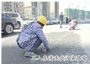
工人在清洗受污染路面

春季以来,首府进入施工季,多个建设项目工地陆续复工、开工。为防治施工扬尘污染,4月11日上午,呼和浩特市城管执法局执法监察人员对我市部分施工现场进行了突击检查。