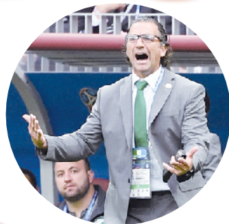
沙特主帅皮济如何排兵布阵？

6月20日23时，A组第二轮比赛将在乌拉圭和沙特之间展开。在小组首战中，乌拉圭凭借马竞中卫吉梅内斯第89分钟的头球绝杀，1:0艰难击败法老军团埃及，目前与东道主俄罗斯同积3分，因净胜球劣势排名小组第二。此战面对小组实力最弱的沙特，只要击败对手就基本锁定一个出线名额。沙特在揭幕战中被俄罗斯5:0横扫，出线希望已经微乎其微。