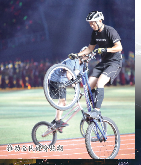
推动全民健身热潮