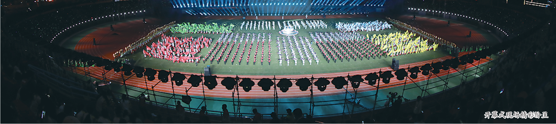
开幕式现场精彩纷呈