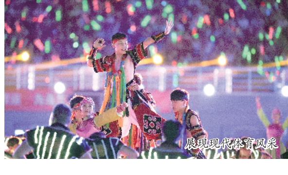
展现现代体育风采