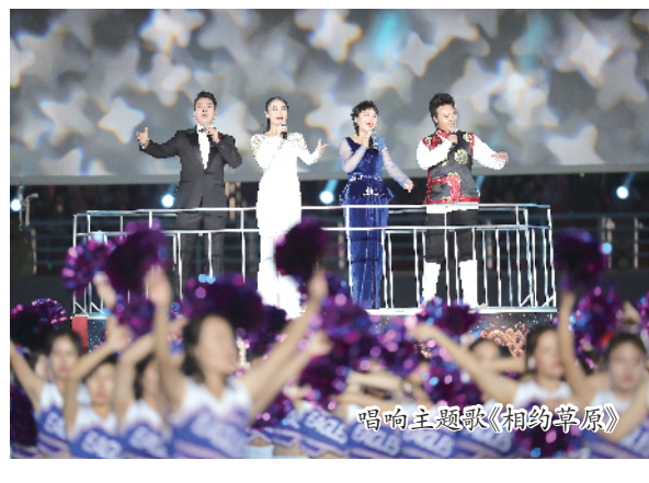
唱响主题歌《相约草原》