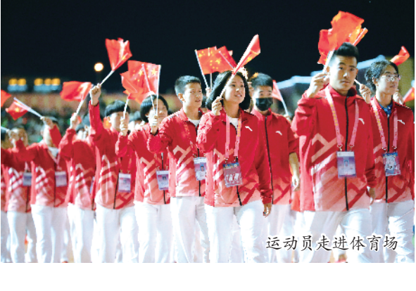
运动员走进体育场