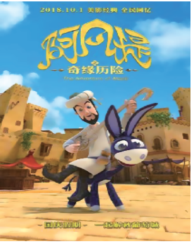
央,那个骑着毛驴的阿凡提又回来了。阿凡提依旧

还记得《阿凡提的故事》里《种金子》、《卖树荫》的故事吗?这些家喻户晓的故事伴随几代人成长,多年过去了,观众们终于可以见到这位阔别已久的老朋友——阿凡提了!3D动画电影《阿凡提之奇缘历险》讲述的是一场突如其来的水荒危机打破了葡萄城的平静生活,在百姓的信任与嘱托下,阿凡提义无反顾地肩负起