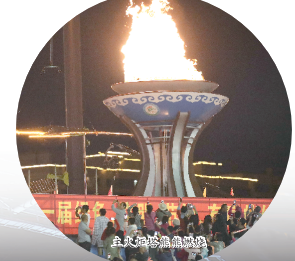
主火炬塔熊熊燃亮