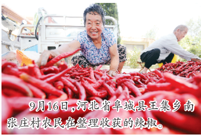
9月16日,河北省阜城县王集乡南张庄村农民在整理收获的辣椒。

五是一律严格落实责任追究。对开具证明过程中出现不作为、乱作为问题的,要及时予以纠正,造成严重后果的,一律严肃追究责任。(熊丰)