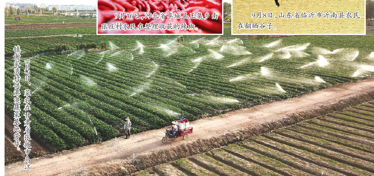
9月1日,菜农在甘肃省张掖市乌江镇谢家湾村供港澳蔬菜基地劳作。