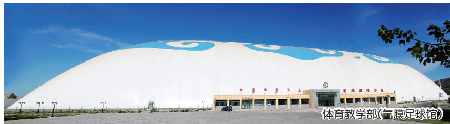
体育教学部(气膜足球场)

现有教师31名,近几年,获得全区优秀体育教师3人次,全区优秀教练员15人次。国家级裁判员2人,国家一级裁判3人。1979年,被国家教育部、国家体委、卫生部 and 共青团中央联合授予“学校体育工作先进集体”;1989年,被国家体委授予“实施《国家体育锻炼标准》先进单位”;1993年,被国家体委授予“群众体育先进单位”。现有各类体育场地合计面积80000多平米,其中室内活动场馆面积43280.78平米,20800平米气膜足球场是经国家田联认证国内最大的室内标准田径场。