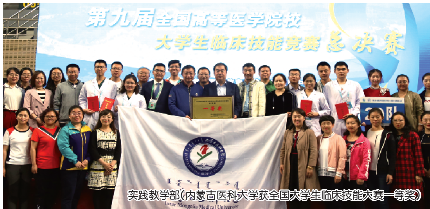
实践教学部(内蒙古医科大学获全国大学生临床技能竞赛一等奖)

实践教学部成立于2014年,前身为临床医学部。主要负责与学校实践教学基地的协调和服务工作,管理实践教学、临床技能中心的建设及临床人文医学教育,组织开展临床教师岗位胜任力竞赛和临床教师师资培训班,规范各基地教学工作;在临床教学医院推进将临床教师本科教学工作与职称评聘、岗位聘用、绩效考核相挂钩的“三挂钩”原则,组织学生参加全国高等医学院校大学生临床技能竞赛,并在2018年获全国总决赛一等奖。