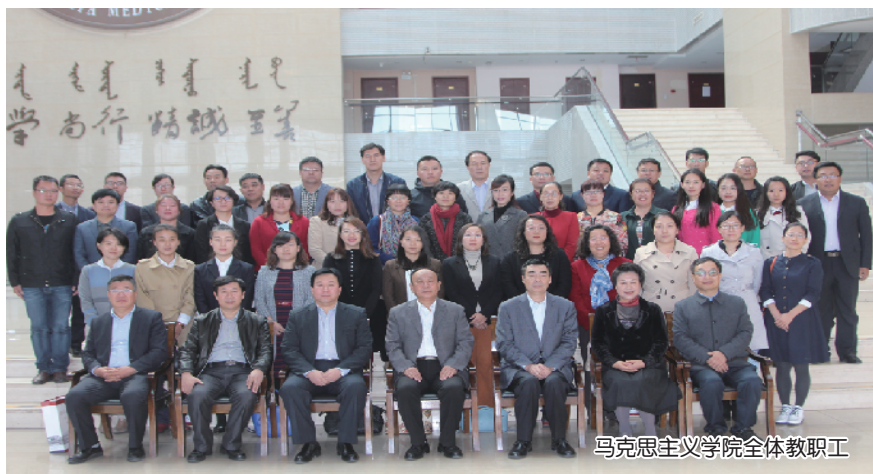
马克思主义学院全体教职工

学院以推动“双引擎”建设为核心,在发展中逐步形成了以“思政课”为核心,以人文素质课、“惟真讲堂”学术讲座为有机组成部分的“大思政”格局。