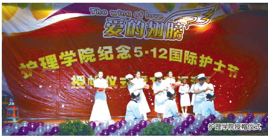
护理学院授帽仪式