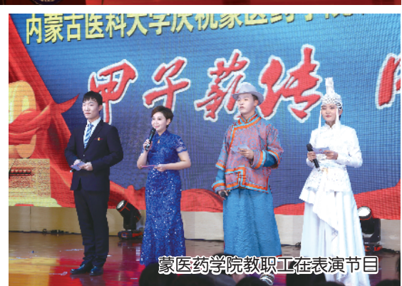
蒙医药学院教职工在表演节目