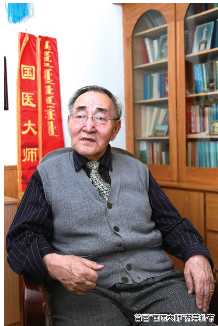
首届“国医大师”苏荣扎布