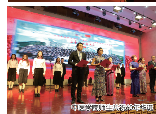
中医学院师生共祝60华诞