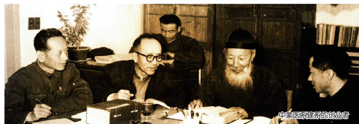
中蒙医系建系的创业者