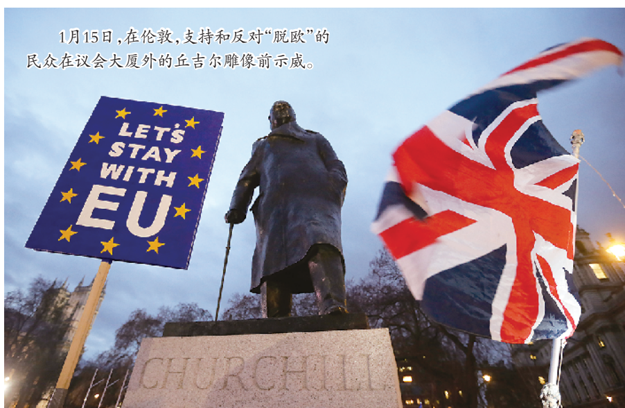
1月15日,在伦敦,支持和反对“脱欧”的民众在议会大厦外的丘吉尔雕像前示威。

英国议会下院原本定于去年12月11日对上述“脱欧”协议进行表决,但特雷莎·梅因担心协议无法通过才将投票推迟至今。分析人士指出,特雷莎·梅在过去一个多月竭