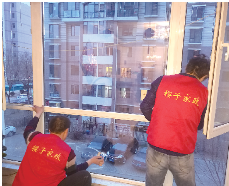
保洁人员为雇主打扫家