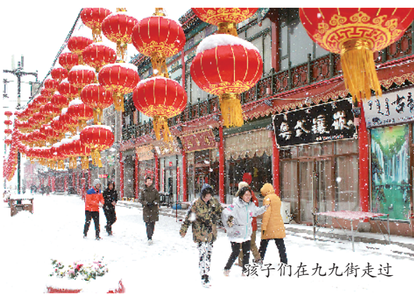
孩子们在九九街走过