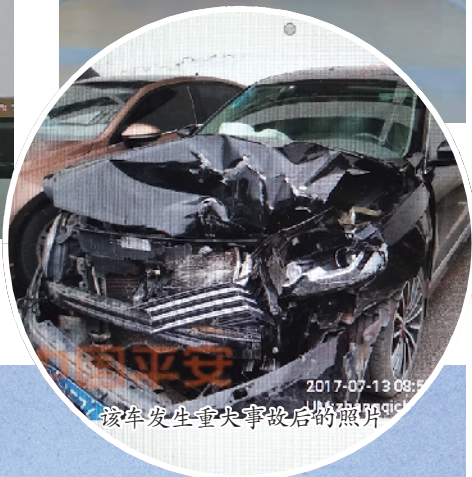
该车发生重大事故后的照片