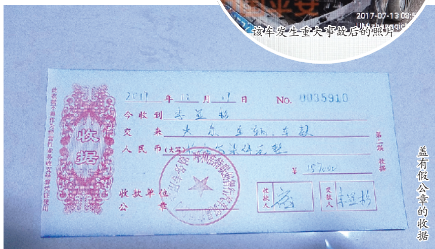
盖有假公章的收据