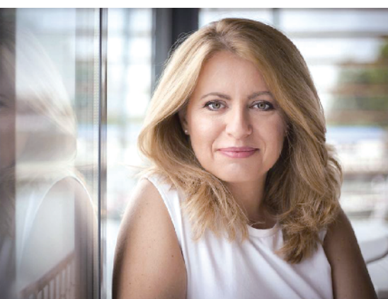
政界新人恰普托娃

得知获胜后,恰普托娃使用斯洛伐克语、匈牙利语、捷克语等多种语言向斯洛伐克所有主要少数群体支持者致谢。“我不仅