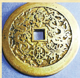
(传)康熙六十大寿万寿钱