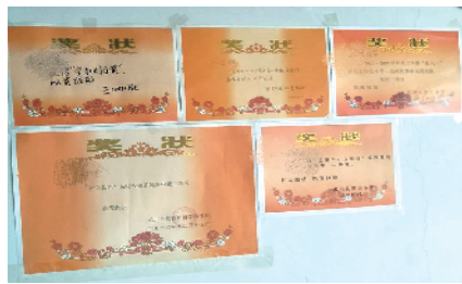
着大大小小的奖状 出租屋墙上挂