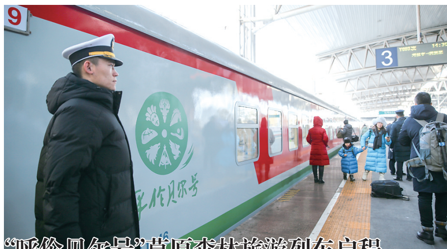
“呼伦贝尔号”草原森林旅游列车启程

新报讯(北方新报融媒体中心记者 牛天甲) 12月24日,“呼伦贝尔号”草原森林旅游列车从呼伦贝尔市海拉尔区出发,前往满洲里市。该列车借鉴国际旅游列车的成功运营经验,打造草原高端旅游。