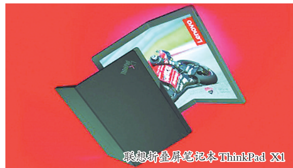
联想折叠屏笔记本 ThinkPad X1

这款阿迪达斯运动鞋看上去非常时尚,貌似与其他高端跑鞋没有太大差别,但事实上它采用创新设计,是一款环保鞋,能够100%循环再利用。这款运动鞋历时7年多完成研究设计,其采用单一材料制作,不使用胶水或者溶剂,阿迪达斯全球品牌战略副总裁詹姆斯·卡恩斯称,循环利用是“清洁环保”的第一步,目前该产品仍处于测试阶段,公测计划预计于2021年公布。