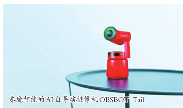
睿魔智能的AI自导演摄像机 OBSBOT Tail