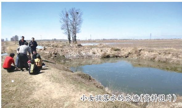
小女孩落水的水塘(资料图片)