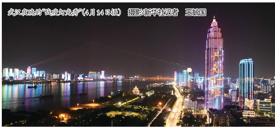
武汉夜晚的“战疫灯光秀”(4月14日摄)