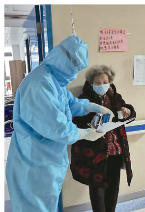
医务人员和老年患者沟通