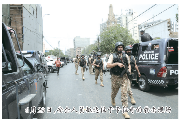
6月29日,安全人员抵达位于卡拉奇的袭击现场

巴基斯坦证券交易所首席执行官法鲁赫·汗对媒体表示,武装人员没有闯入证交所股票交易核心区域。