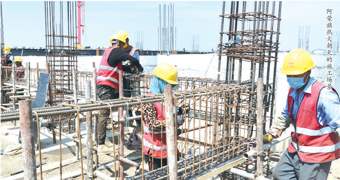
阿荣旗热火朝天的施工场景