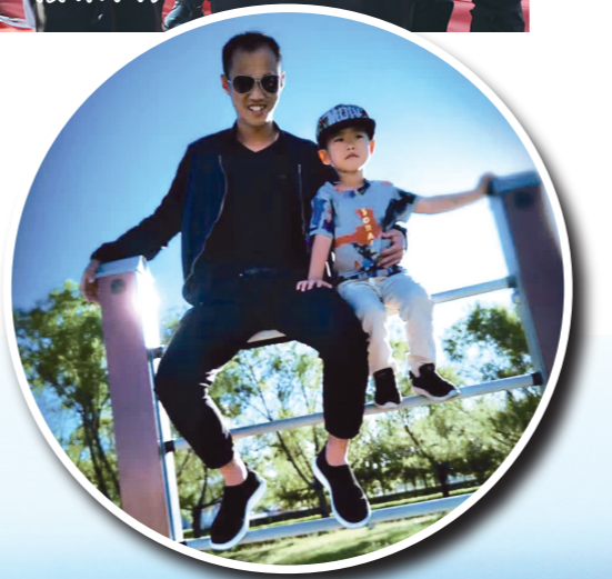
苗浩和儿子的闲暇时光