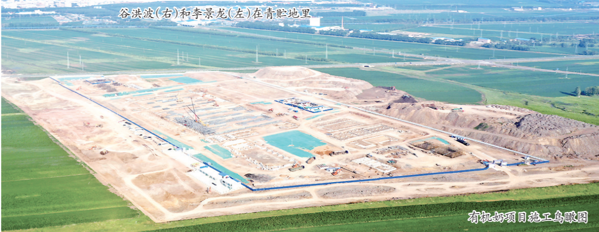
有机奶项目施工鸟瞰图

7月,呼伦贝尔市阿荣旗的伊利有机乳制品项目及奶源地建设如火如荼。作为伊利在区内投建的首个项目基地,阿荣旗正同步推进工厂和奶源基地建设。依托伊利有机乳制品项目,阿荣旗举全旗之力推进奶源基地建设。未来,这里将成为全球最大的有机原奶加工基地。阿荣旗项目,是伊利在区内布局的重要一环,也是内蒙古奶业振兴进程的缩影。在国家和自治区奶业振兴规划之下,伊利勇挑重担,密集启动一系列重大项目,描绘了宏伟的乳业集群蓝图。未来,地处北纬黄金奶源带的内蒙古,必将是世界高端乳制品市场上一道亮丽风景线。