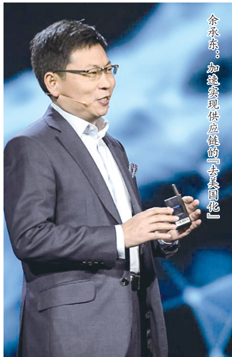
余承东:加速实现供应链的「去美国化」

而从产业来看,中国智能手机在全球出货量第一,占比达到57%。中国(包括中国大陆和台湾)PC产量占全球PC产量的一半左右;中国电视机品牌在全球占比1/3左右,仅次于韩国三星和LG,但远远超过了日本厂家。