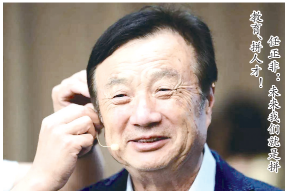
任正非:未来我们就是拼教育,拼人才!