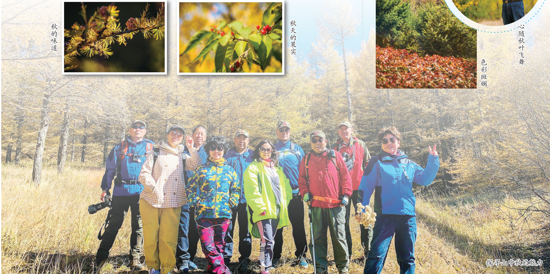
探寻山中秋的魅力