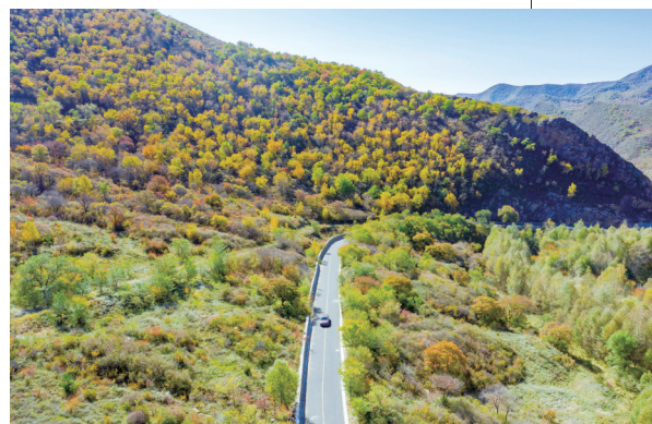
行驶在“五颜六色”中