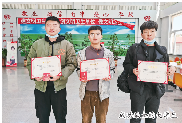
成功献血的大学生