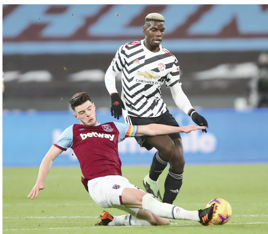
博格巴(右)在比赛中与西汉姆球员莱斯拼抢