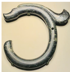
红山文化C形碧玉龙

“龙的形象就是一种和合团结的象征,它表现了中华民族远古的祖先的一种极其宝贵的和合精神,这是我们民族精神的一个源头。”北京大学人类学与民