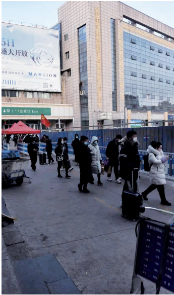
在呼和浩特火车站,黑车司机混杂在出站人群中。