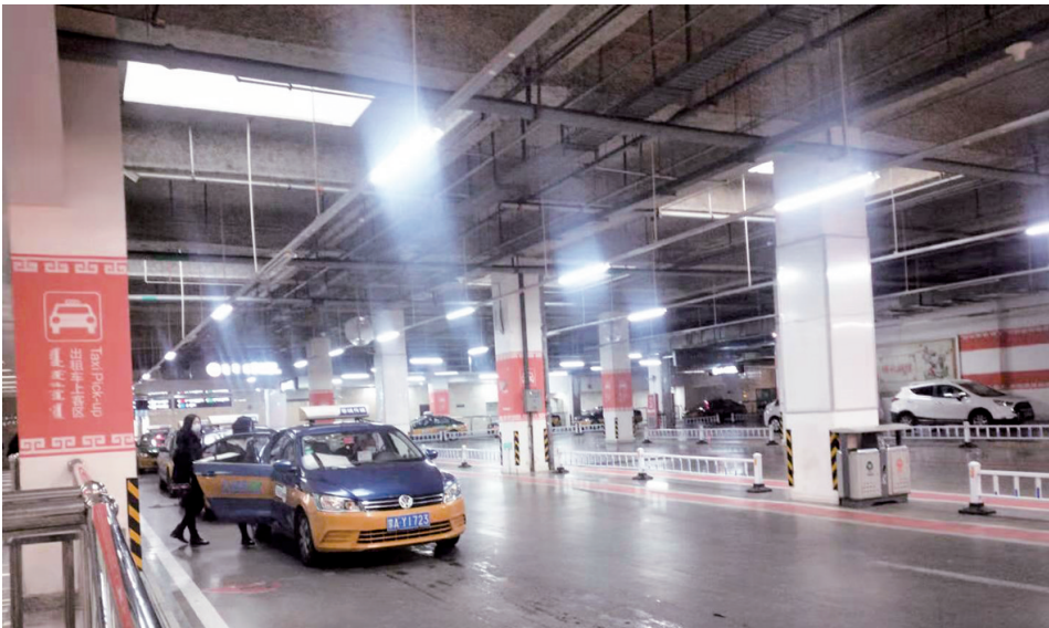
呼和浩特东站的正规出租车乘降点秩序井然