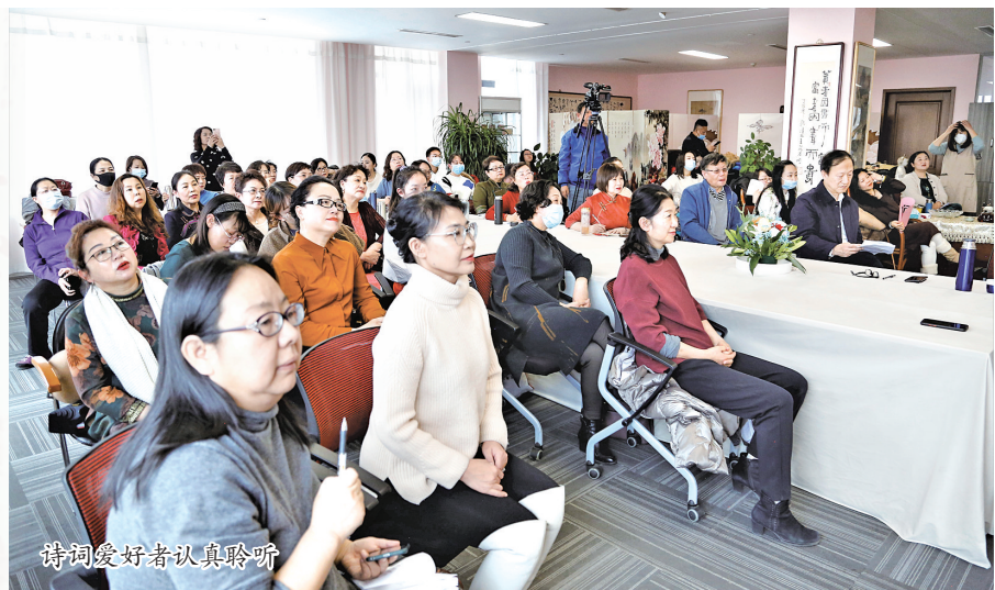
诗词爱好者认真聆听