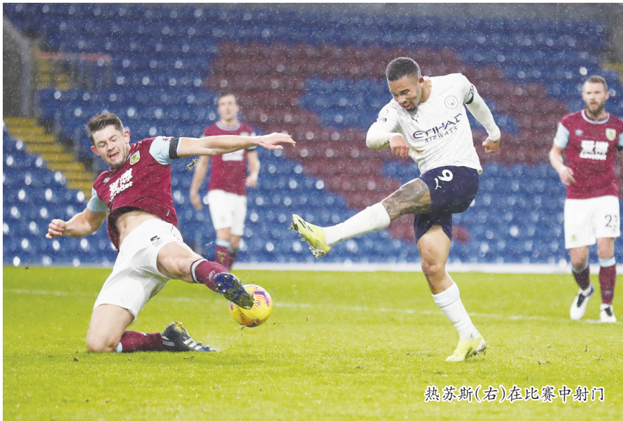
热苏斯(右)在比赛中射门

第108分钟,巴萨再入一球,梅西禁区边缘的射门被对方门将亚伦扑出,德容跟进补射破网。第113分钟,格列兹曼禁区内挑传左路,阿尔巴劲射远角得手,为巴萨将比分锁定在5:3。(谢宇智)