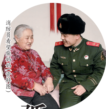
消防员看望柴妈妈(资料图)