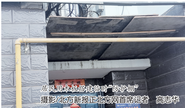
居民用木板搭建临时“防护棚”