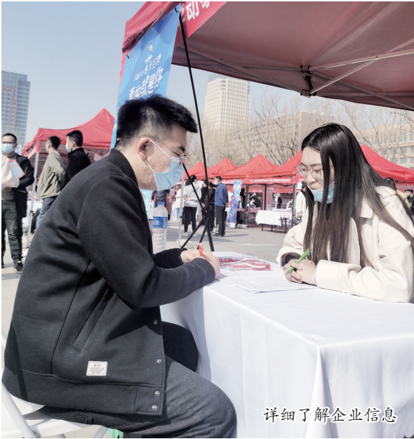
详细了解企业信息

同样,内蒙古永瑞环保科技有限公司也急招环保工程师、微生物研发工程师等人才。该公司李姓负责人告诉记者,目前关于环保方面的人才严重缺乏,当天投递简历的人并不多。为了招到人才,公司放宽条件,专业不对口的求职者也可以应聘,公司会