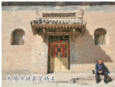
木质斗拱甚是精美