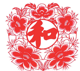
刘静兰作品《和和美美》