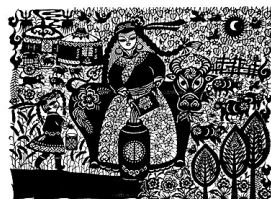
荣凤敏作品《乳香飘》