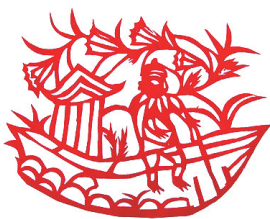
高粉梅作品《过黄河》