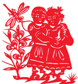
张花女作品《一家亲》