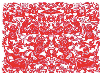
王红川作品《乌兰牧骑在草原》

短,从而催生了对不同民俗文化的相互认同。久而久之,这些极富生命力的文化符号便深深地印刻在中华大地上,呈现出一幅蔚为壮观的绚烂图景。