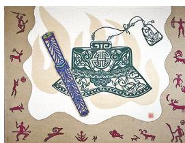
苏梅作品《流金岁月》