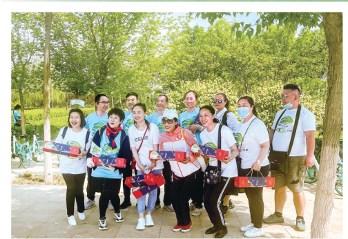
骑友们来张大合影