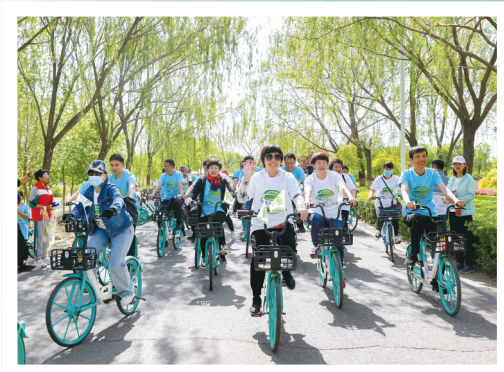
吸引了众多市民参与