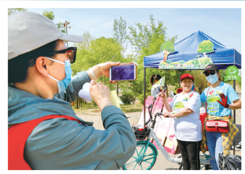
来张合影记录一下