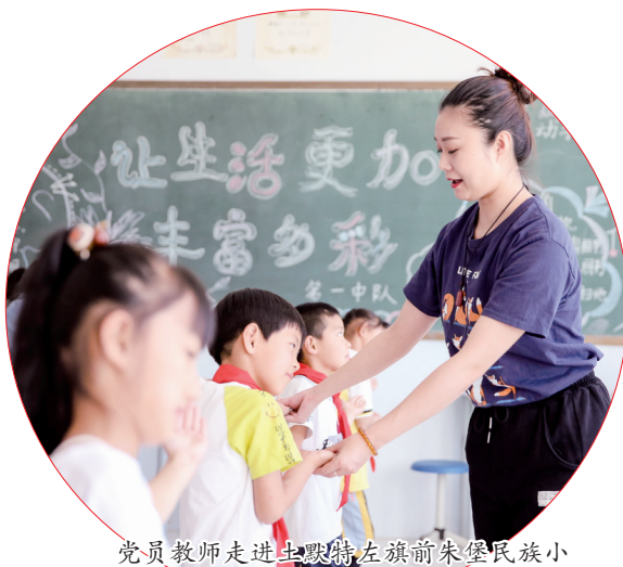
党员教师走进土默特左旗前朱堡民族小学为乡村学生普及趣味教育