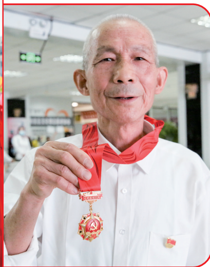
老党员展示“光荣在党50年”纪念章