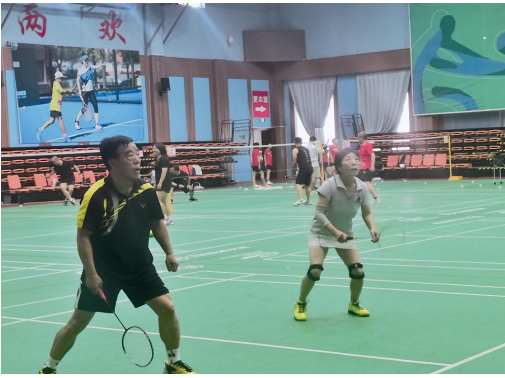
老人们享受免费羽毛球场馆