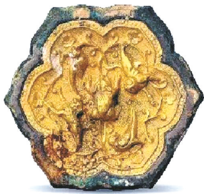
唐瑞兽禽鸟金背镜