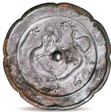
唐『千秋万春』铭盘龙葵花镜