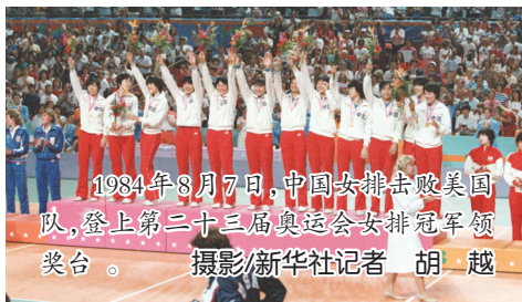
1984年8月7日,中国女排击败美国队,登上第二十三届奥运会女排冠军领奖台。