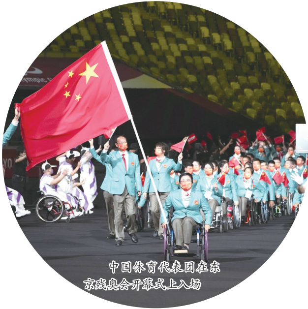
中国体育代表团在东京残奥会开幕式上入场