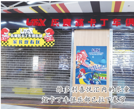
维多利喜悦汇内的乐童炫卡丁车俱乐部已拉下卷帘