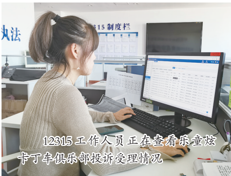
12315工作人员正在查看乐童炫卡丁车俱乐部投诉受理情况