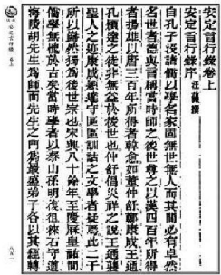
记录胡瑗教育思想的《安定言行录》

胡瑗向他讲修身的道理。这位学生经胡瑗教导后,幡然醒悟,发愤读书,几年后考中了进士。 由于胡瑗“教法最备”,人们都愿意跟他学习,正所谓“人皆乐从而有成”。 胡瑗的弟子遍布朝野,其中最出名的当推北宋理学大师程颐。程颐曾于皇祐年间在太学从师胡瑗,胡瑗以“颜子所好何学”试题考学生,程颐的“学以至圣人之道”答卷,深得胡瑗赏识,后来程颐成为易学大师,他著作《伊川易传》深受胡瑗的影响。