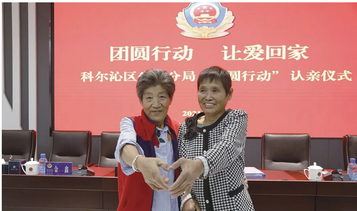
团圆行动 让爱回家 科尔沁区公安分局“团圆行动”认亲仪式