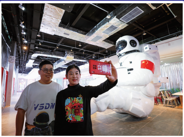
和超大宇航员合个影