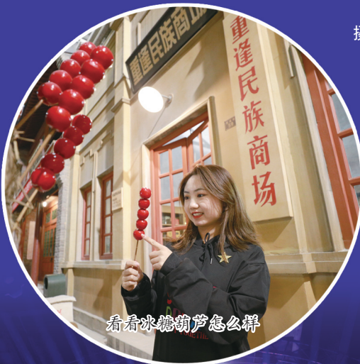
看看冰糖葫芦怎么样