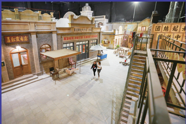
行走在怀旧老街区