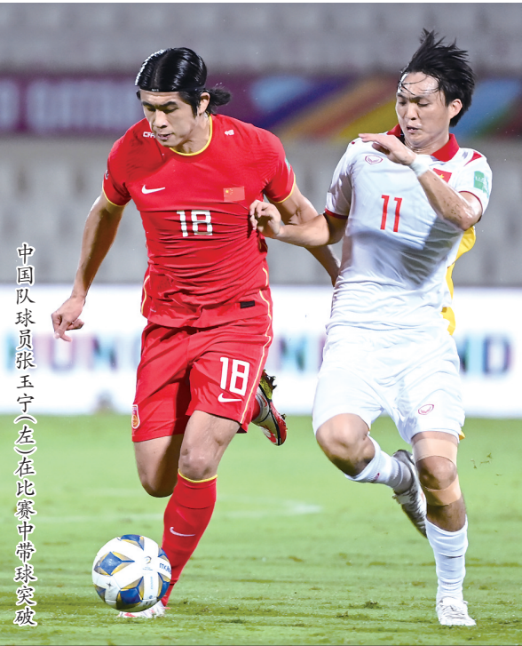
中国球员张玉宁(左)在比赛中带球突破