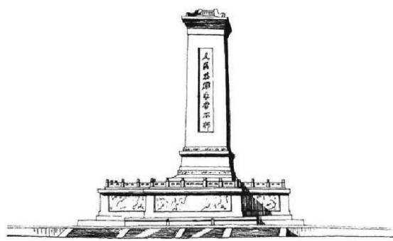
1952年初拟定以碑文为主题、以浮雕为衬托的设计方案,并以此为准绘制设计图。

1951年初,在多个设计方案中,有三个方案得到了专家们的认可。一个是五分之一缩尺的大模型。这个模型的台座为红墙,墙上有三个门洞,台座上立碑。另外两个是小模型,一个是坡屋顶,另一个是群像顶。这三个设计方