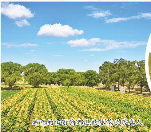
希望的田野商都县的葵花长势喜人