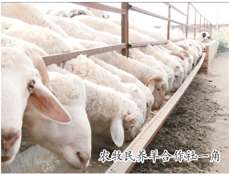
农牧民养羊合作社一角