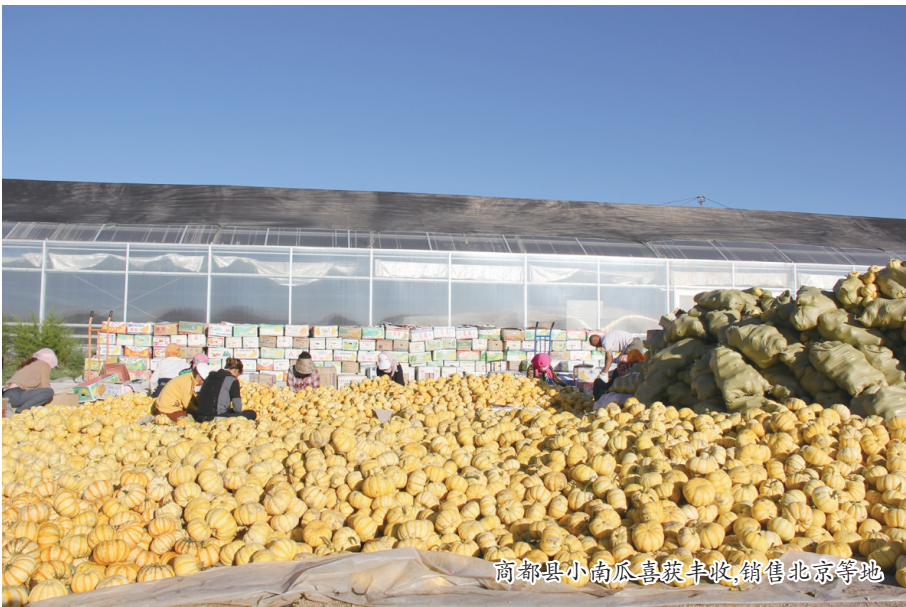
商都县小南瓜喜获丰收,销售北京等地

仅2021年,就筛选确定京蒙扶贫协作项目16个。其中基础设施类2个、产业合作类4个、劳务协作类1个、人才培养类6个、社会事业类2个、其他类1个,涉及京蒙扶贫协作资