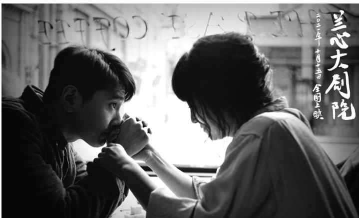
赵又廷(左)饰演话剧导演谭呐