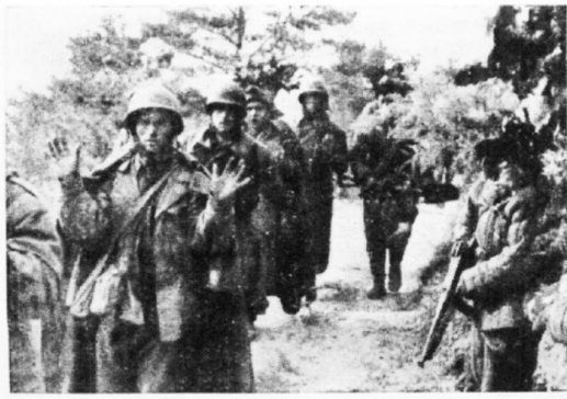
美军俘虏惶悚地举着双手。